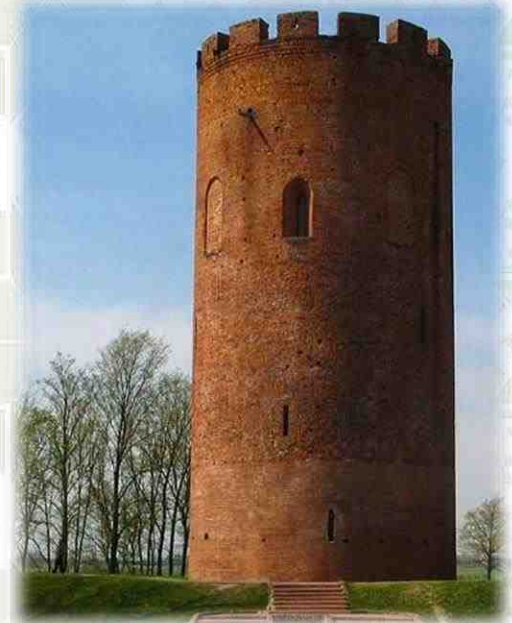
Каменецкая (Белая) вежа