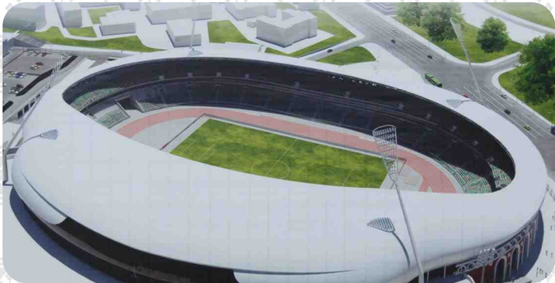
Национальный олимпийский стадион «Динамо»