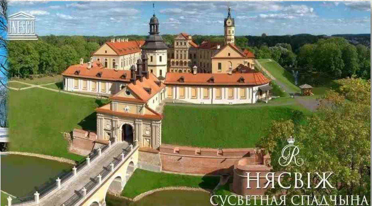
НЯСВИЖ СУСВЕТНАЯ СПАДЧЫНА