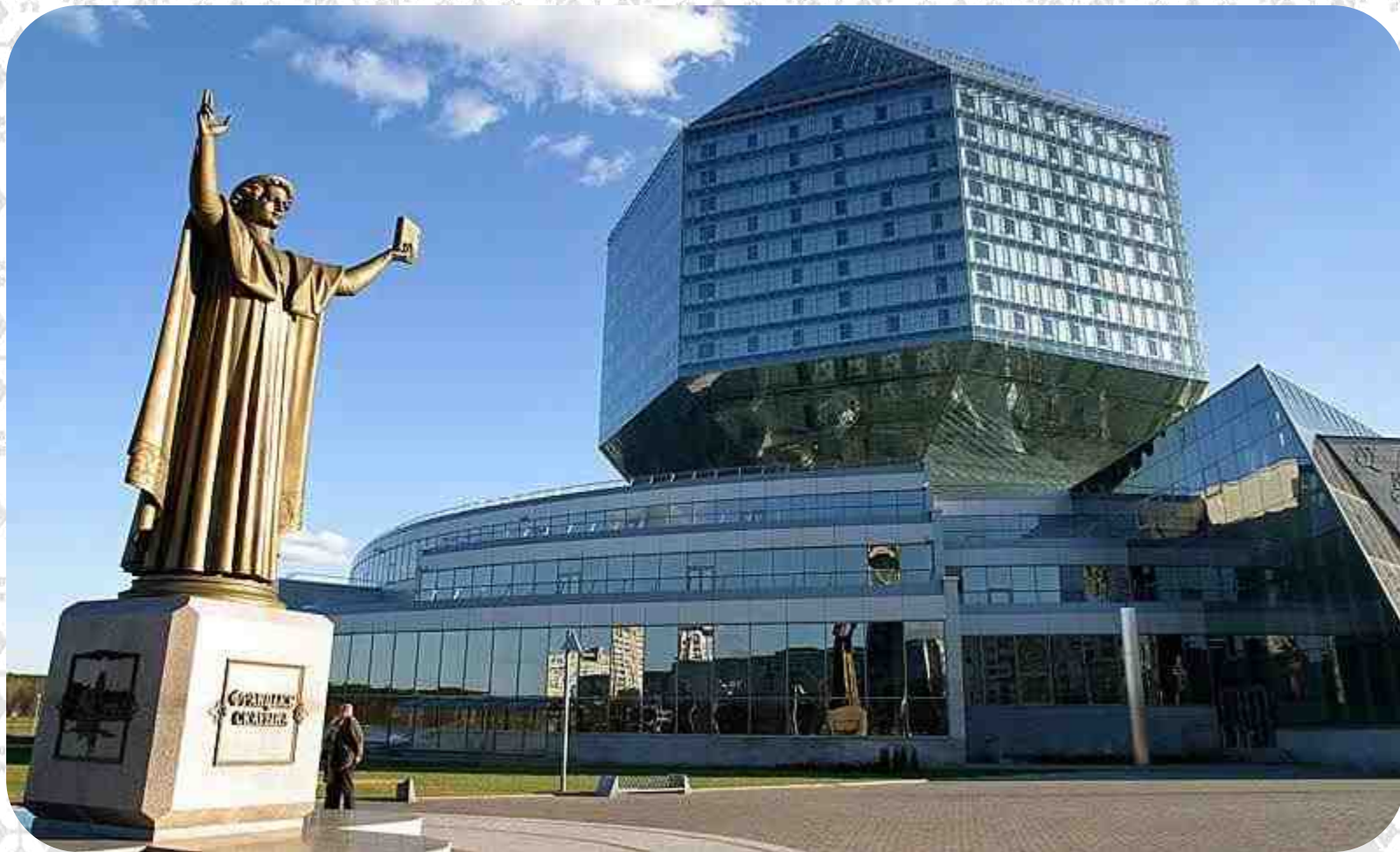
Национальная библиотека Республики Беларусь