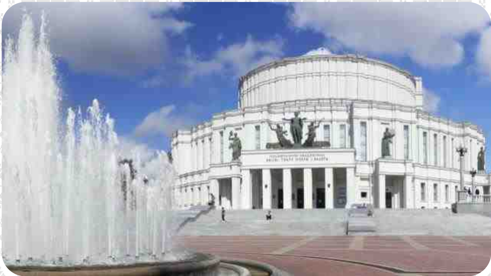
Национальный академический Большой театр оперы и балета Беларуси