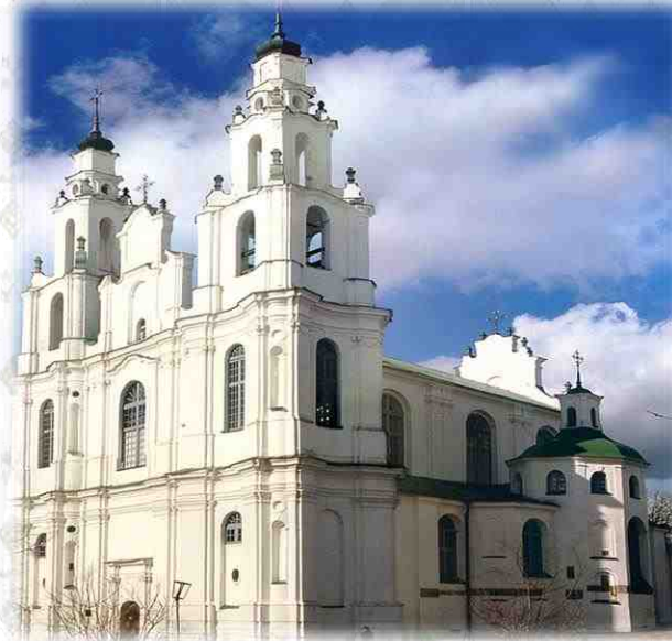
Софийский собор в Полоцке