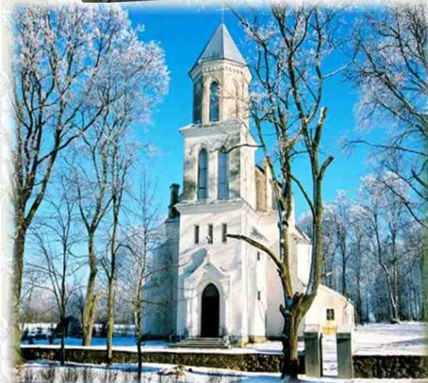
Костёл Святого Казимира (Вселюб)